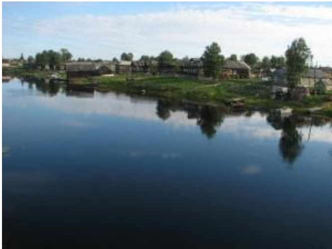
д. Сумский Посад